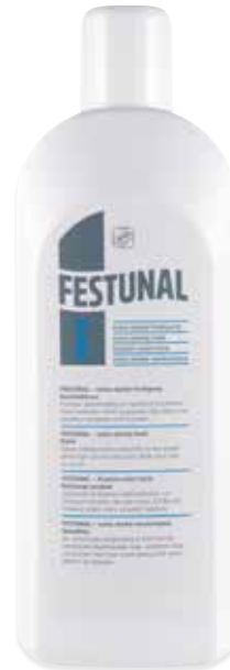
FESTUNAL FORTE extra starke Festigung Nr. 428 1000 ml