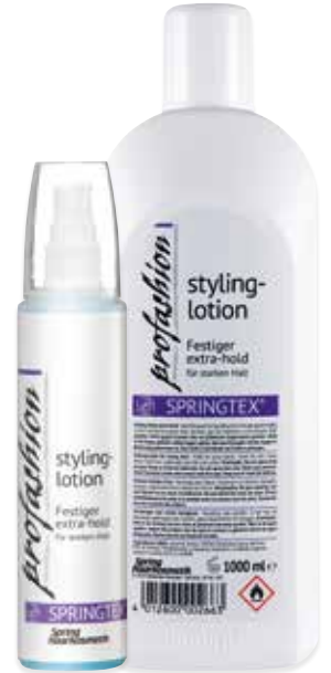
Styling-lotion Festiger extra-hold für starken Halt Nr. 591E 200 ml Nr. 591 VE 12 x 200 ml Nr. 447 1000 ml